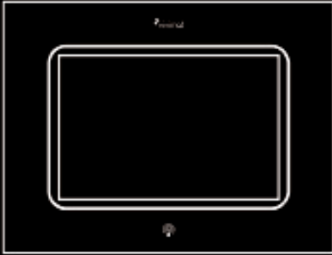
VISION COLOR-7 colour touch screen شاشة تعمل باللمس بلون VISION COLOR-7