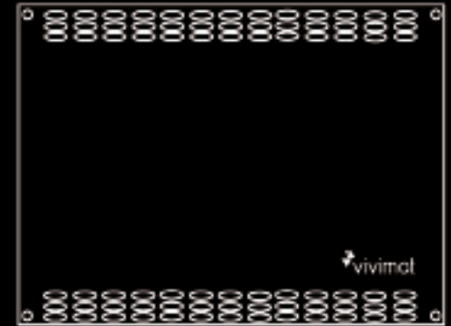
vivimat ® 3.0 controller board